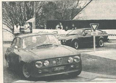
DIMANCHE, AU STADE DE CHEMEAU. Les voitures de sport ont rencontré un vif succès auprès du public.

minutes. Plus de 400 personnes ont participé à ces baptêmes. Les bénéfices (6.000 €) seront reversés à l'association « Enfants et Santé » pour la lutte contre le cancer, avec l'aide d'une centaine de voitures de sport présentes : Porsche, Ferrari, Alfa Romeo. Si la plupart des véhicules ont tourné toute la journée sur le circuit, d'autres étaient exposés pour le plaisir des visiteurs, et une tombola était proposée avec, comme premier prix, une journée offerte par Zone Rouge, pour l'essai de véhicules de luxe.